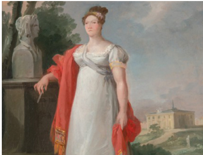
Retrato de la reina María Isabel de Braganza frente al Real Casino (1817), de Juan Gálvez

María Isabel de Braganza (Lisboa, 1797-Aranjuez, 1818) murió de parto con solo 21 años. Pese a su breve existencia y juventud, la que